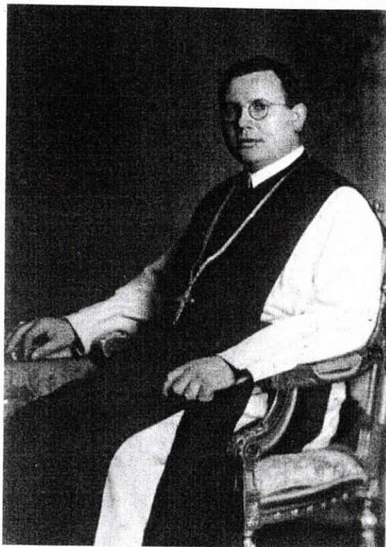
A börtönévek előtt

Arról a hat esztendőről írok, amelyet hazámban, Magyarországon kommunista fogságban töltöttem: 1950. október 29 – 1956. november 1-ig, Mindenszentek ragyogóan sugárzó ünnepének félhárom órájáig. Akkor