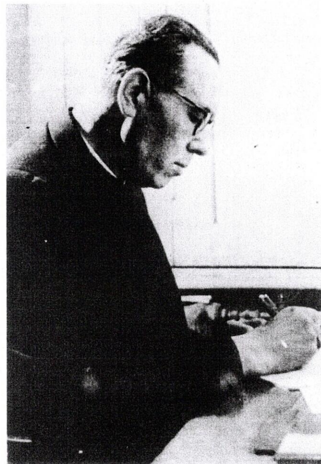
A 6 év börtön után

Velem együtt akkor kb. nyolcszázhatvan politikai rab szabadult abból az egy börtönből. Kb. esti hat óra lehetett, mikor utolsónak átléptem a