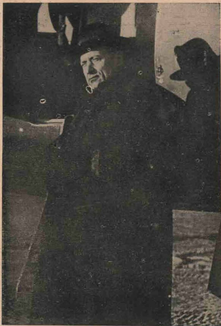
1. Mindszenty római útjára indul az amerikai misszió által rendelkezésére bocsátott repülőgépen.