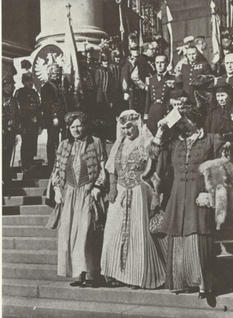
vitéz nagybányai Horthy Miklósné, a Kongresszus fővédőnője, jobbján Zsófia főhercegnő, balján Augustza főhercegnő