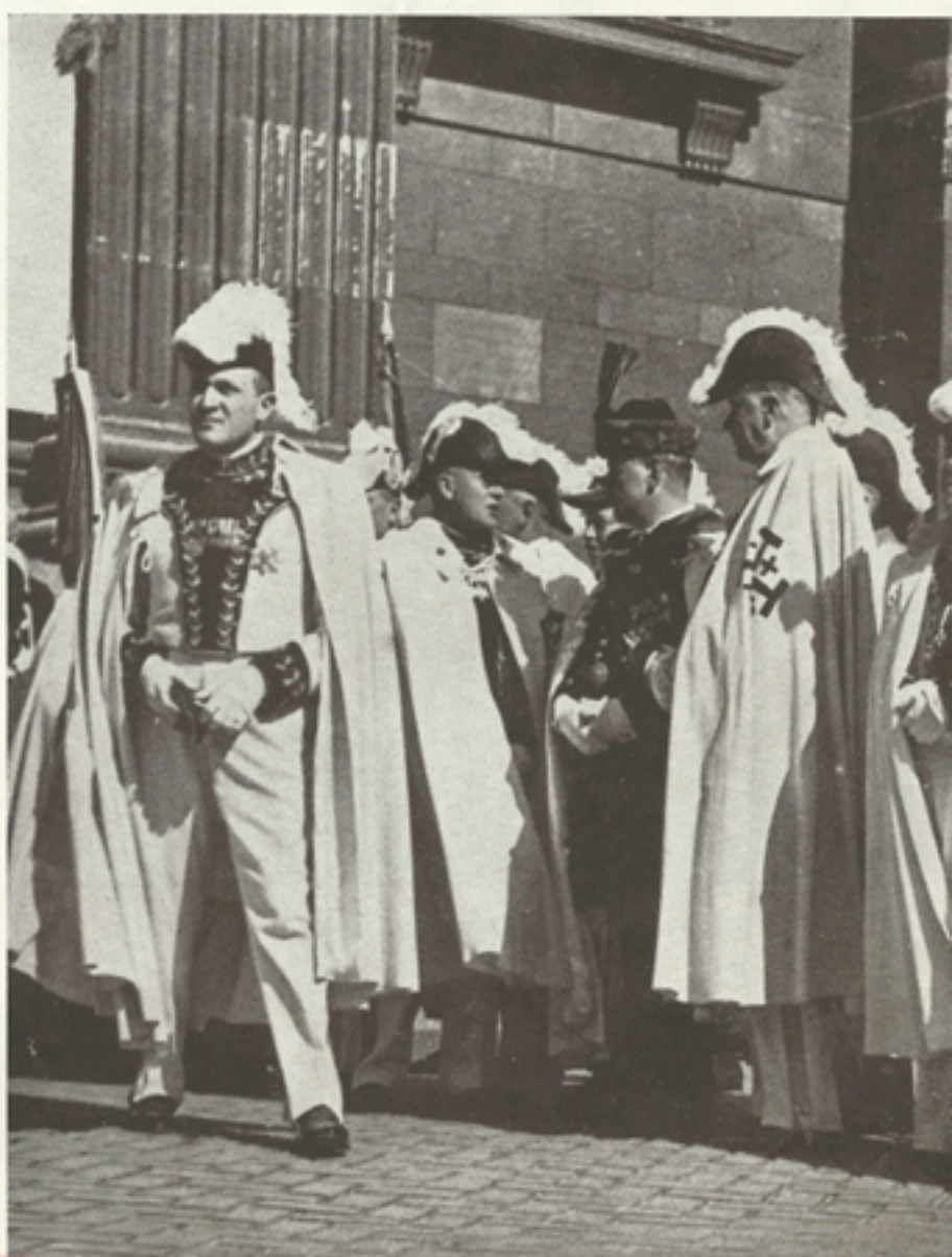
A Jeruzsálemi Szent Sir Lovagrend tagjai a körmenetben