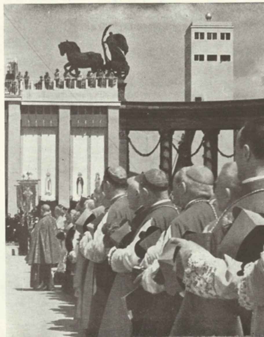
Egyházi előkelőségek sorfala oltáremelvény előtt