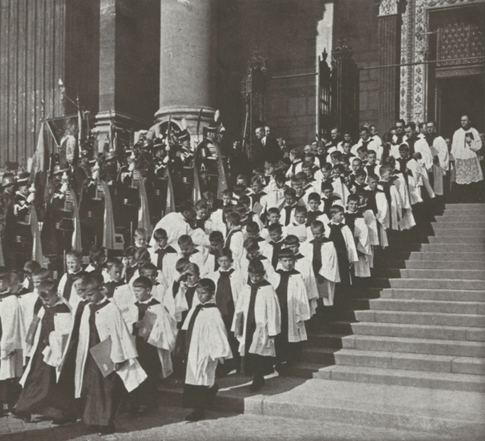
A körmenet dísz-százada, a vármegyei címereket tartó hajdúk s a várakozó Scola Cantorum a Bazilika lépcsőin

nuncius és az Eucharisztikus Állandó Bizottság tagjai, majd Imrédy Béla miniszterelnök. Mögötte a főhercegek, József, József Ferenc és Albrecht, majd balján Augusztia főhercegasszony, jobbján Albrecht főherceg felesége társaságában: vitéz nagybányai Horthy Miklósné, a kormányzó felesége, a budapesti kongresszus fővédnöke. A tábornoki küldöttség, a kormány tagjai következtek, majd kettes sorokban a miniszterek feleségei és a főúri hölgyek káprázatosan szép, régi és új női díszruhákban. A mélyzöldtől a türkiskékig, a nehéz bársonytól és arannyal átszőtt brokáttól a könnyű, lehelletfinom, áttetsző tüllig a nemes anyagok minden változata az ízlés harmóniájában hullámozott rajtuk. Gyémántok és más ékkövek tüze villogott rajtuk, amint méltóságteljes lassúsággal lépdeltek.