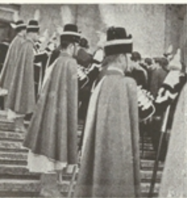
Jelenetek a körmenetből

ISTEN UTÁN, AKIT AZ EUCHARISZTIKUS kenyérben itt jelenlevőként imádunk, hódoló tisztelettel és gyermeki készséggel hálát mondunk szeretett közös atyánknak, XI. Pius pápának, aki e kongresszust nekünk kegyelmesen engedélyezte s annak ügyét atyai imádságával, szavaival és a fő-