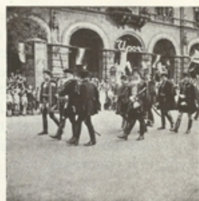
Jelenetek a körmenetből

útvonalakon. Ugyanolyan fegyelmettséggel oszlott is szét és vonult haza. A nekik szánt beszédek, amelyeknek ekkor és itt, a Hősök terén, a tömegek látománya és vonulása alatt kellett volna elhangzaniok, este hangzottak el, az esőtől elfátyolozott város millió fénye felett, a rádió hangszóróiban. Az első a bíboros=hercegprímás latinnyelvű, majd magyarnyelvű beszéde volt.