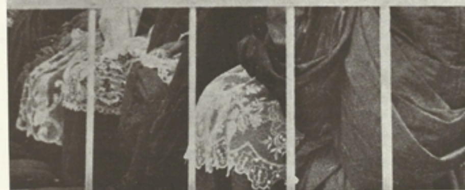
Bíborosok a pápai legátus szentmiséje alatt