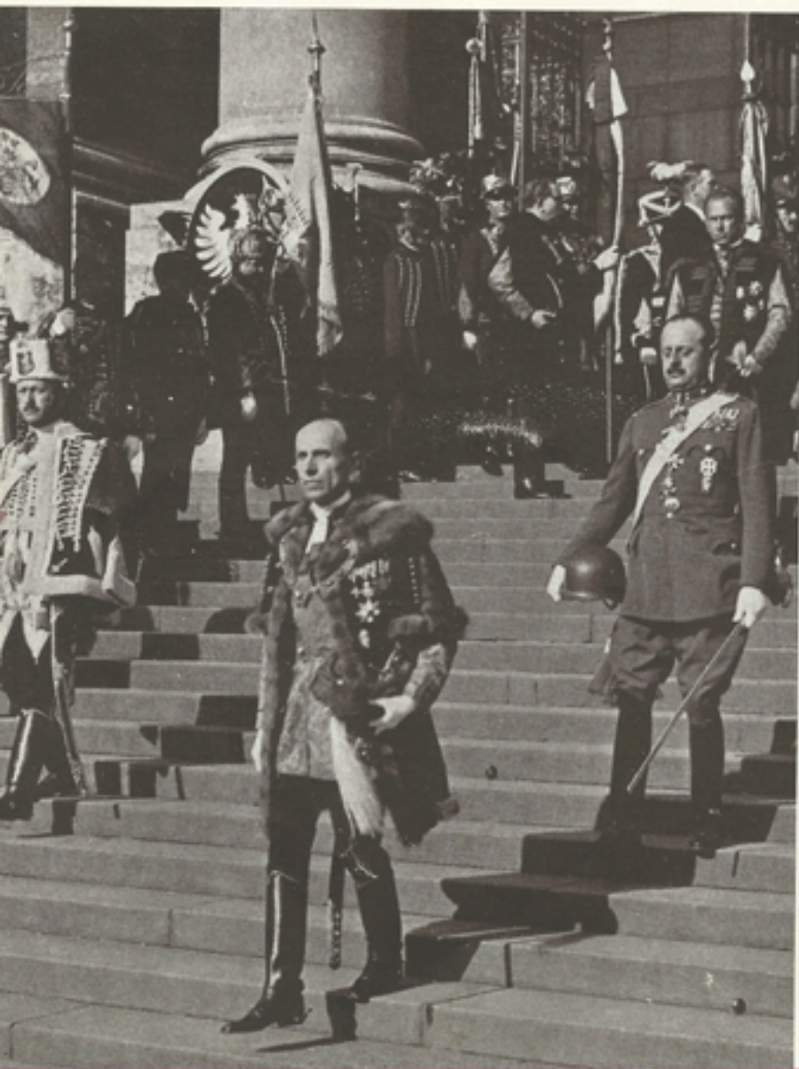
Imrédy Béla m. kir. miniszterelnök a menetben (A lépcső tetején Albrecht főherceg)

A magyar falvak messze vidékeinek népe áradt el az Andrássy-út két sor háza között s a magyar vendégszeretet, a közös hit szolidaritása szívesen ölelte magához a külföldieket, köztük elsősorban az új impériumok magyarjait. Hatalmas éljenzés és taps áradt a lengyel csoport felé, amely fölött két rúdra kifeszítve lengett a hosszú fehér zászló, rajta ezzel a felírással: «Polonia Semper Fidelis».