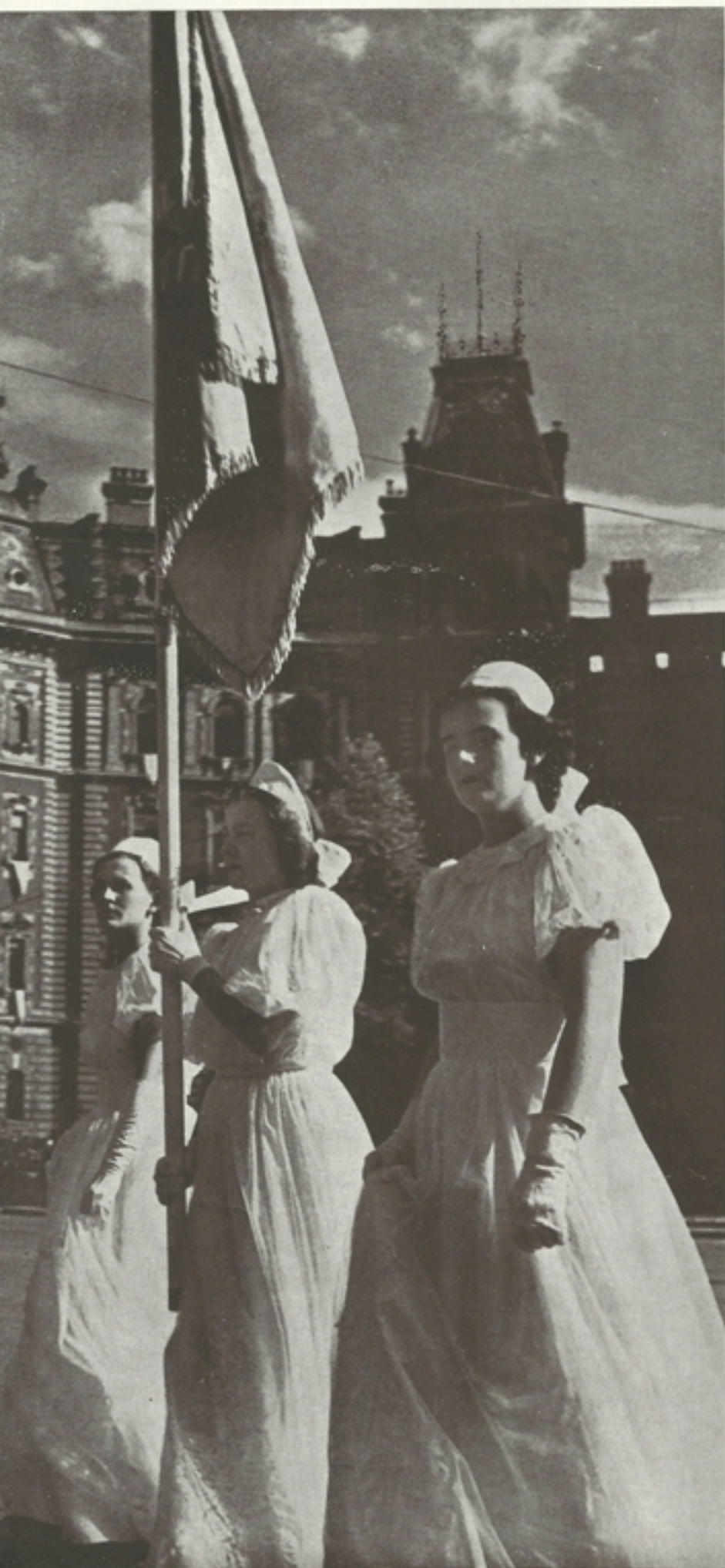
Leányegyesületek zászlai a Mussolini-téren

GYÖNYÖRŰ, NAPOS IDŐ VOLT, AMIKOR a körmenet elindult a Bazilika előtt s mire az Operához ért, nyugat felől már tornyosodtak a nehéz fellegek. A Mussolini-térenél már mindenkit ért néhány esőcsepp, s mire a körmenet dereka a Kövöndre ért, megeredtek az ég csatornái. Amikor az Oltáriszentség a Hősök-terére ért, zuhogó esőben borultak térdre a téren elhelyezkedett százezres tömegek.