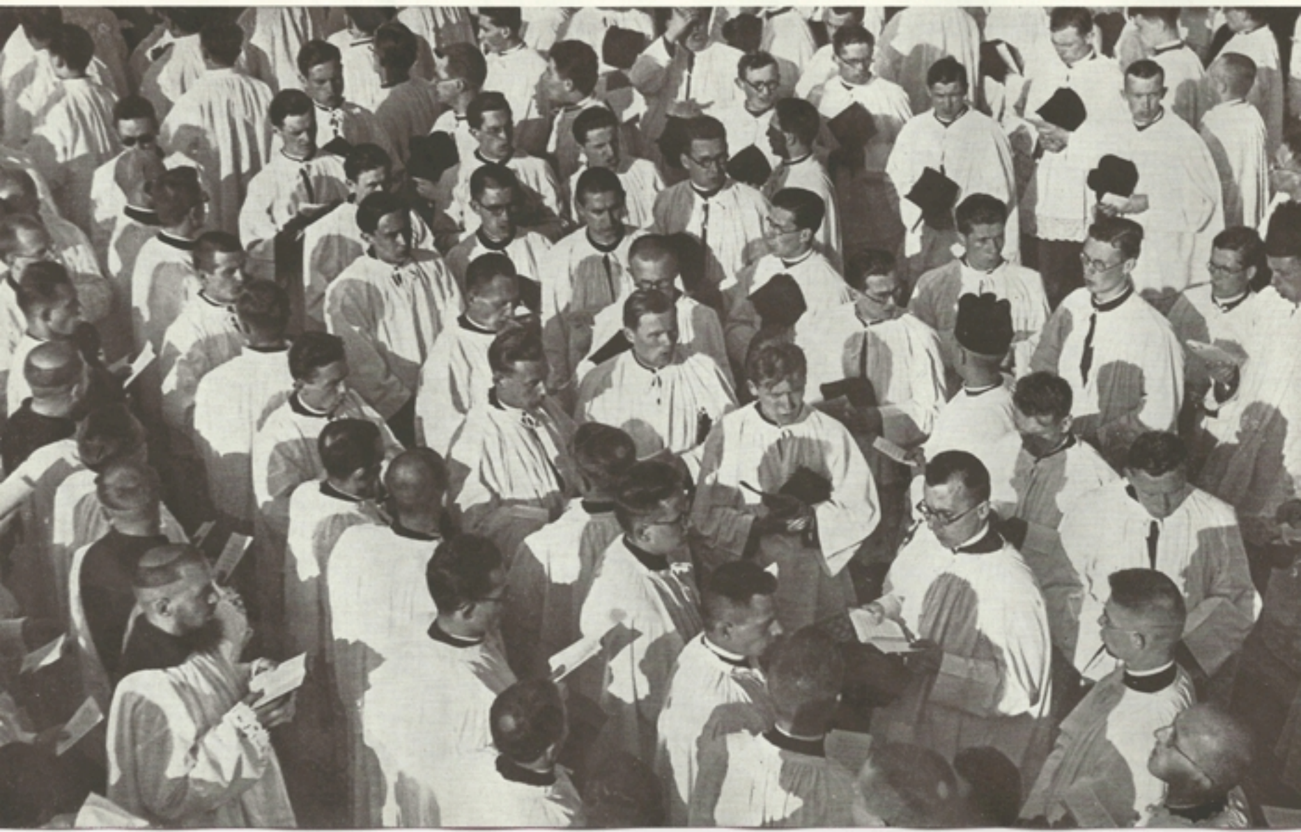
A kispapok kórusa

Ez a szentmise valóban a «minden nemzetek felett» uralkodó Krisztus miséje volt, «minden nemzetek felett», a Kongresszus összes zarándokai felett hangzott el.