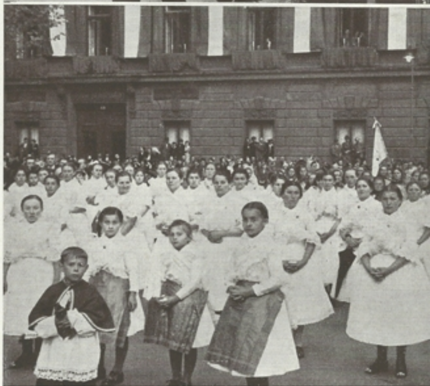
Salgótarjáni bányászok és falusi lányok a Bazilika előtt

fiúk századai meneteltek. Mögéjük záródott a körmeneti kereszt, amelyet a szerzetesrendek, majd a hazai alsópapság, azután az egyházi dignitáriusok, a püspökök és az érsekek követtek. Utánuk óriási csoportban vonult az egyházi ruhát viselő papság, amelynek sorát a magyar püspöki kar tagjai zárták be. Félöt órakor csengetyűszó jelezte a kapuban, hogy közeleg a Legszentebb. Az Oltáriszentséget a baldachin alatt a bíboros=legátus vitte, teljes kíséretétől követve. A baldachin mellett haladt egyik oldalon a Pázmány Péter Tudományegyetem tanácsa, élén a rektorral, a másik oldalon a főváros vezetősége, élén a polgármesterrel. Itt haladtak a Szent Sír= és Máltai lovagrend tagjai, a maguk ősi, gyönyörű öltözkéiben.