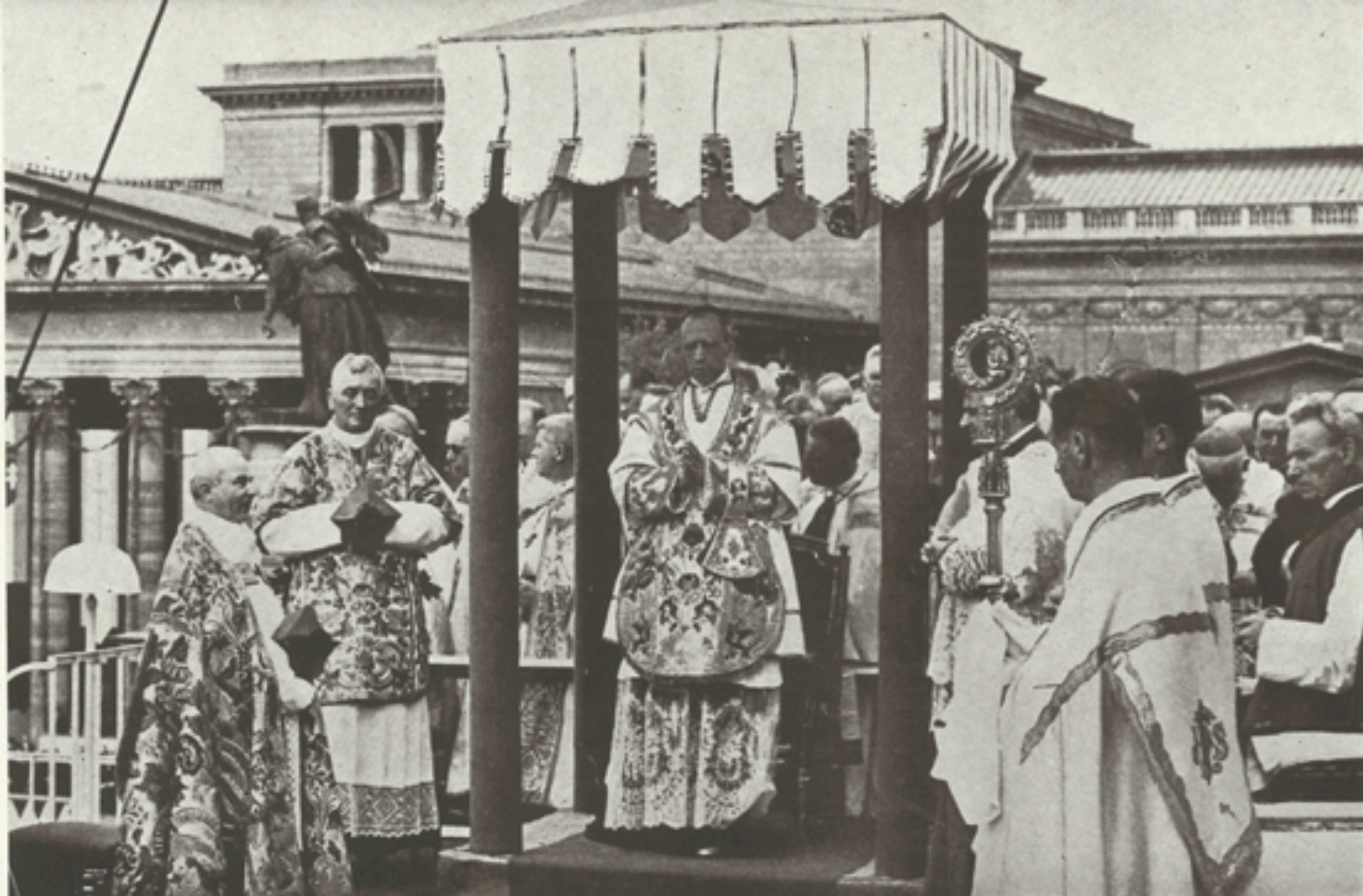
A legátus trónusa

esztergomi kincstár birtokában lévő egyik ősrégi miseruhát viselte. A szertartást Carlo Grano pápai szertartásmester, magyar részről pedig Czapik Gyula preláтусkanonok vezette.