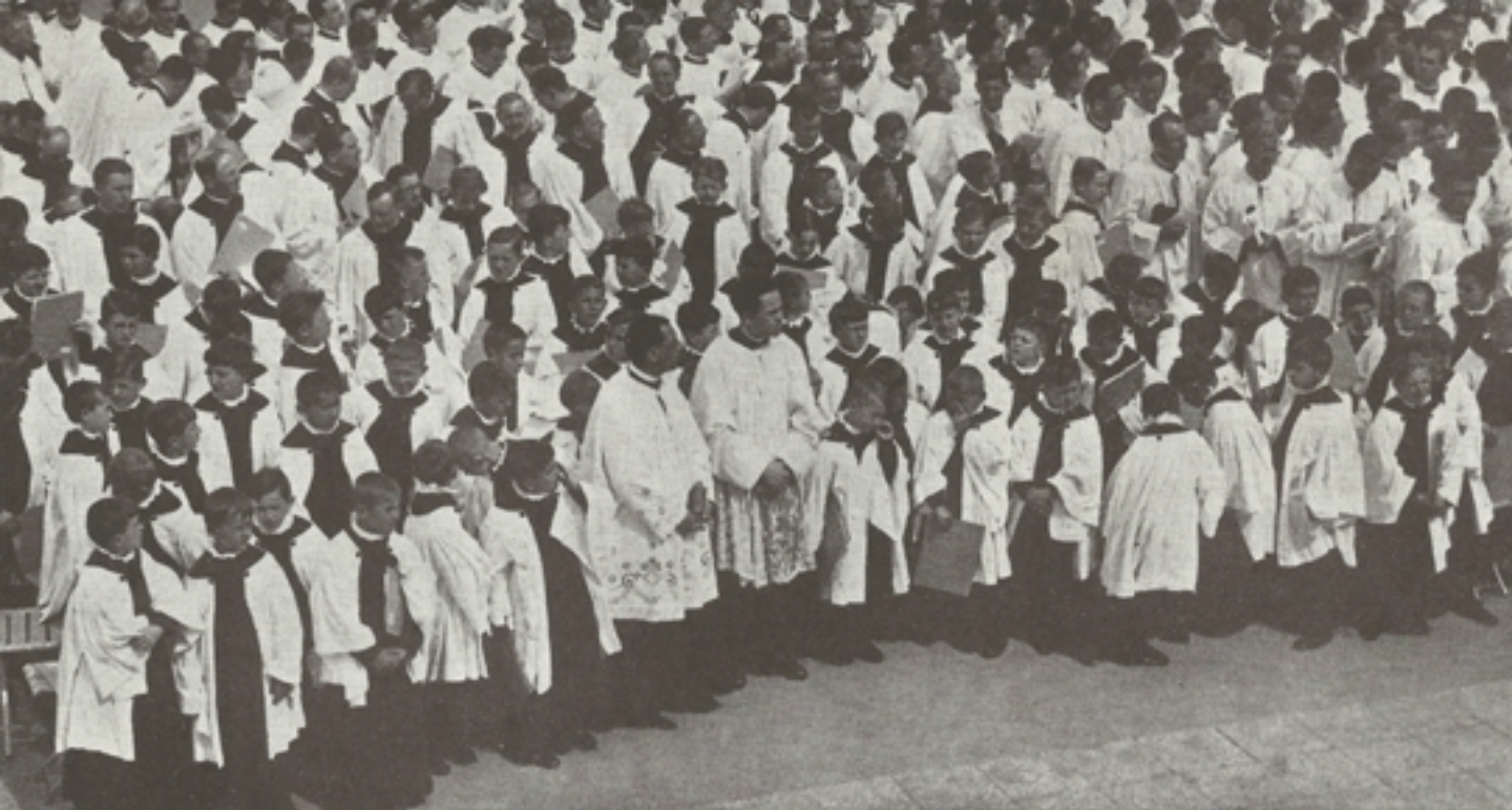
A Scola Cantorum Sabariensis

a multnak emlékeit, hanem a magyarok ősi és gyakorlati hitét nagy lelki gyönyörűséggel csodáltuk.