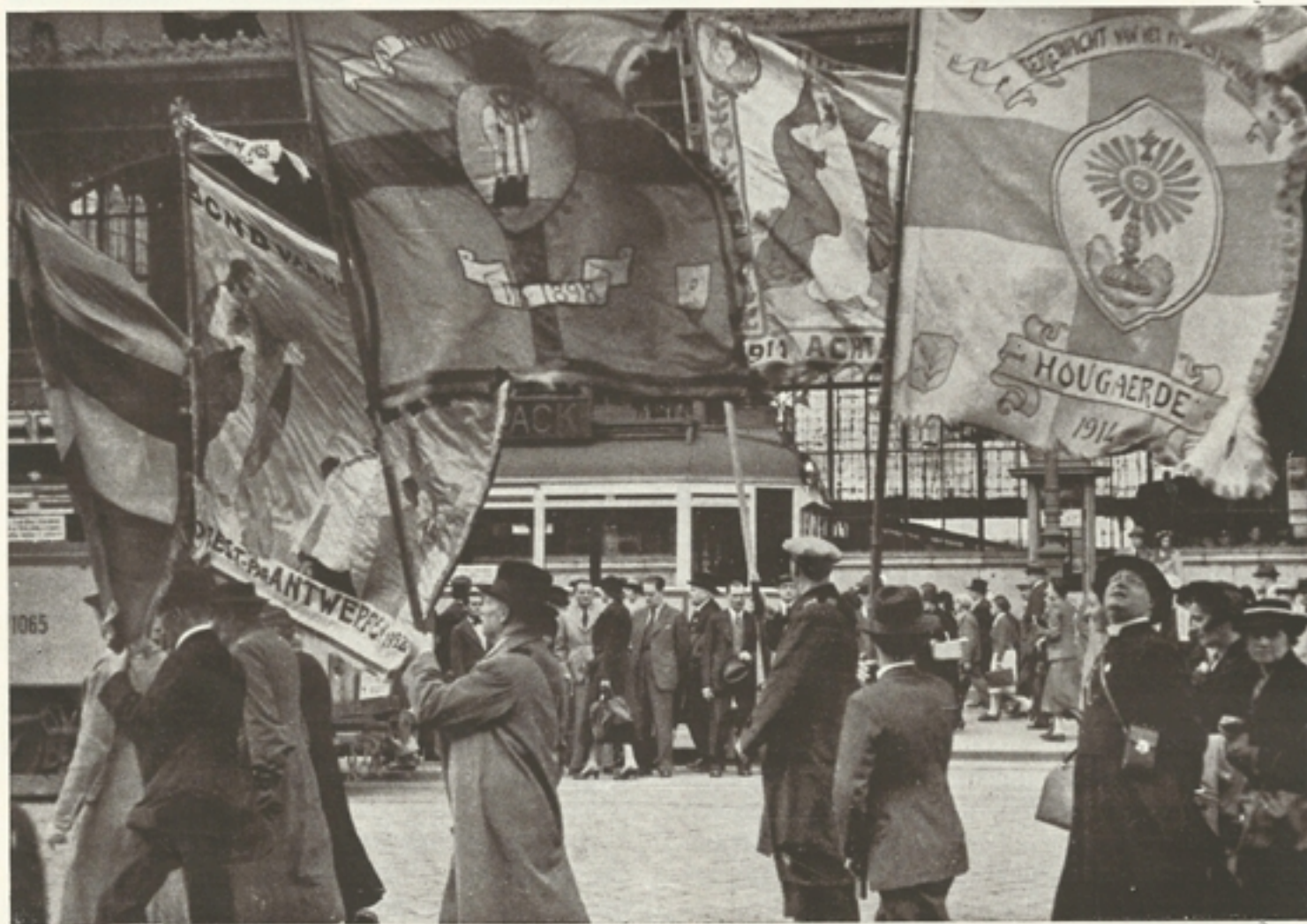
Belgium zászlói a körmenetben

sága elnökének és e bizottság tagjainak, akinek pártoló javaslatára rendelte el a Szentséges Atya, hogy ez a kongresszus Budapesten tartassék. Hasonlóképpen köszönetet mondunk a nemzeti bizottságok összes tagjainak, akik Magyarországon és a külföldön kongresszusunkat mind a lelkieket és anyagiakat mind pedig a technikai részt illetően bámulatos buzgalommal és szorgalommal előkészítették s annak sikerét bármi módon előmozdították.