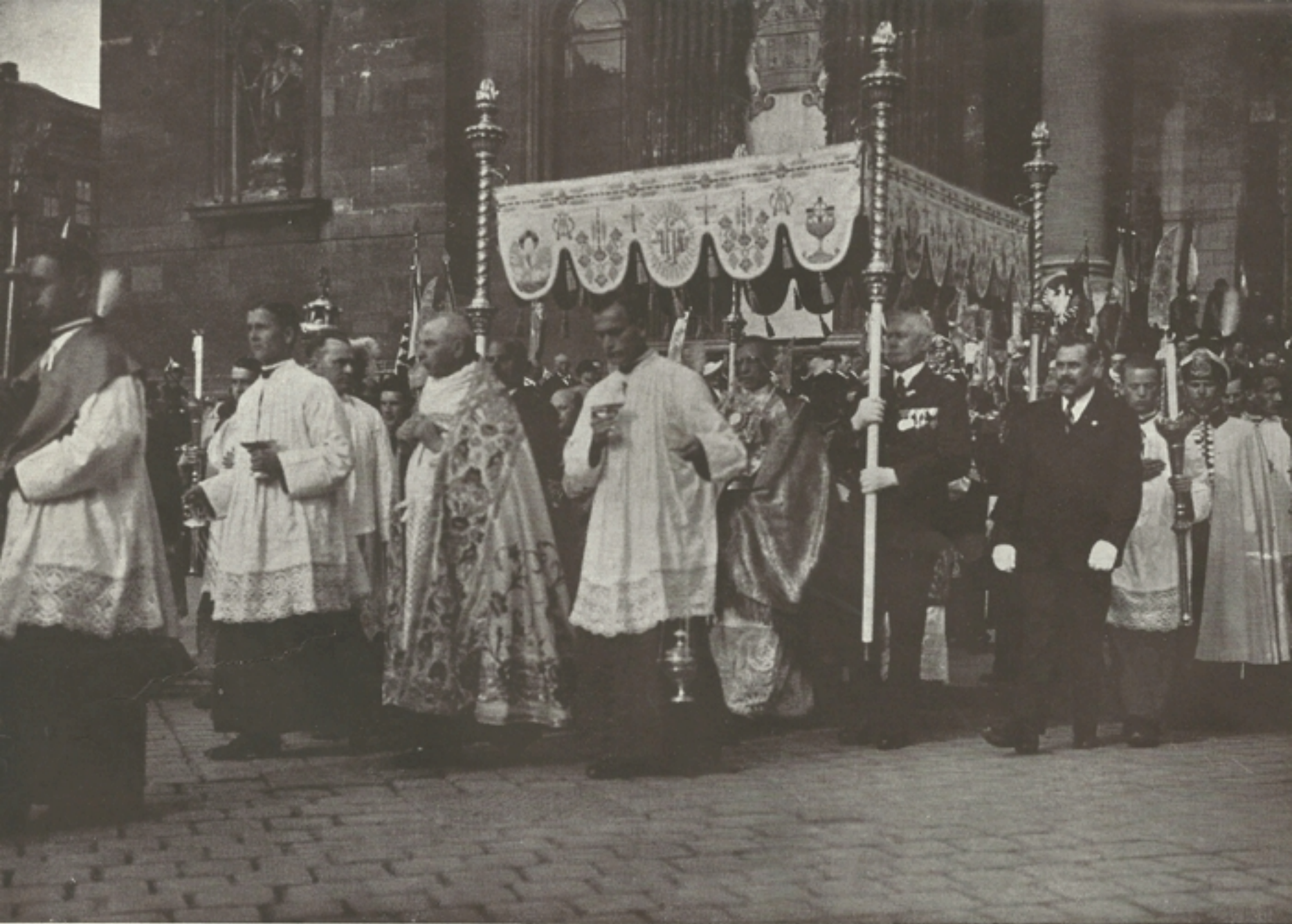
Elindul a Legszentebb a baldachin alatt