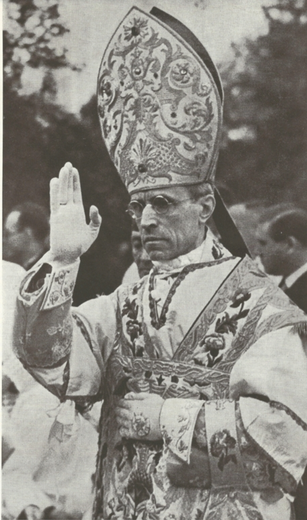
A bíboros-legátus, mint Őszent- sége helyettese: pápai áldást ad

kat, hanem örökre megmaradandókat. Táplálja az ősi hitet, növelje az égi javak vágyát és reményét, az isteni szeretet lángját pedig, a keresztény erényesség táplálóját úgy élessze és táplálja, hogy azok is, akik az Úr Krisztustól szánandóan eltéve-