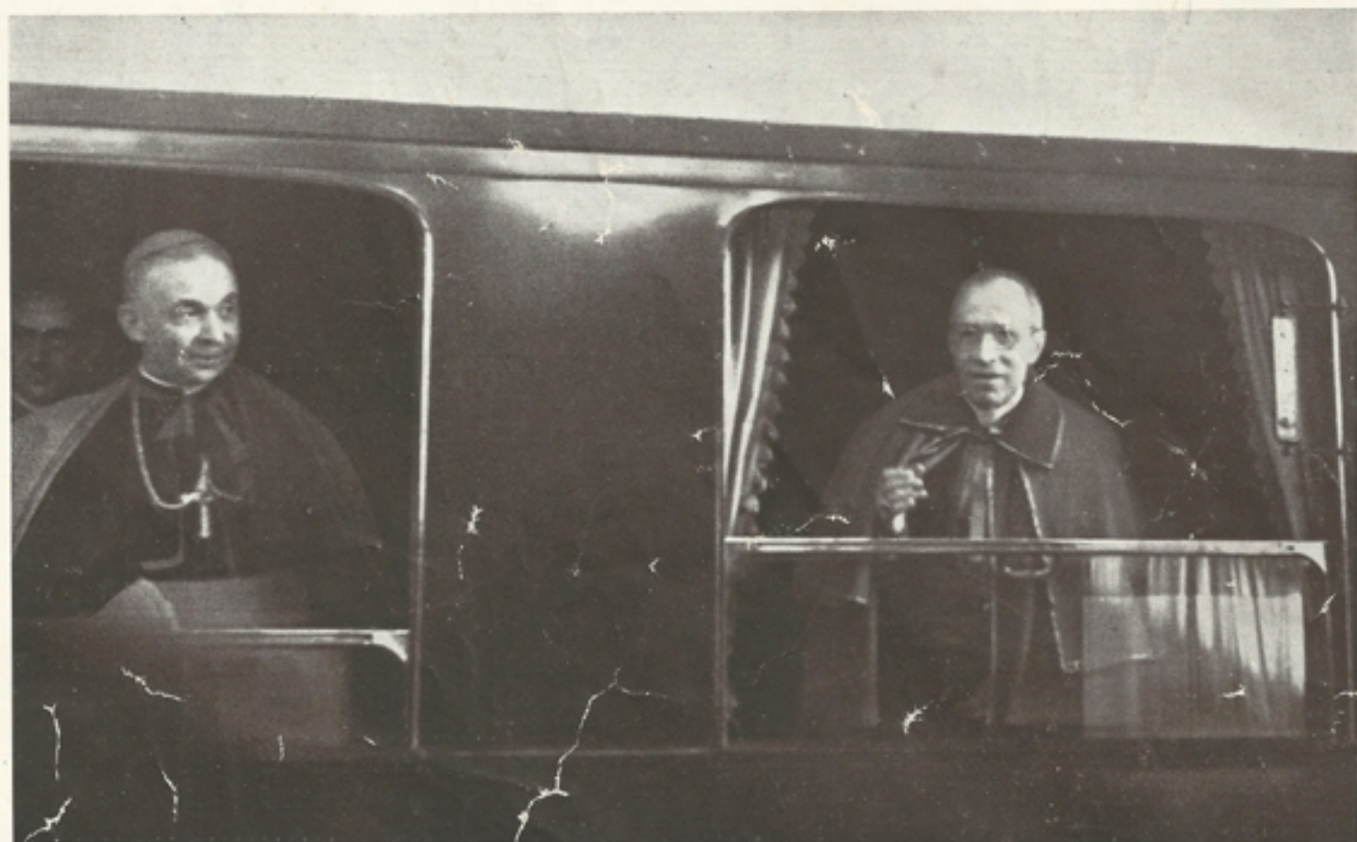
Pacelli Jenő bíboros-legátus búcsút int a magyar fővárosnak (A vonat másik ablakában Angelo Rotta pápai nuncius)

szállott a kocsiba. Ugyancsak beszállott a vonatba Serédi Jusztinián bíboros=hercegprímás, aki egészen Nagykanizsáig kísérte a pápa legátusát. Pontosan 6 órakor indulást jeleztek. Pacelli bíboros-legátus a szalónkocsi ablakából áldást osztott a jelenlévőkre.