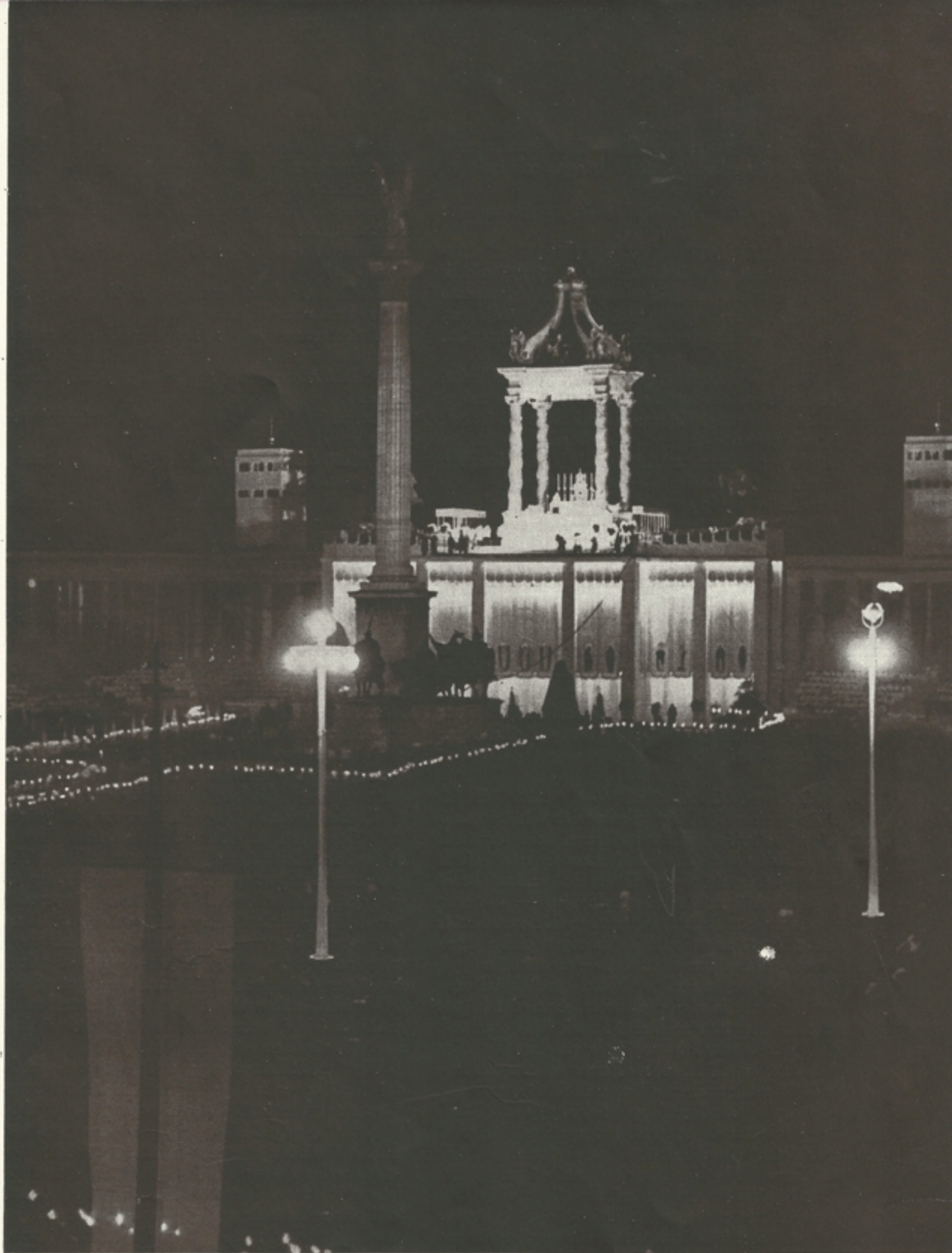
A csodálatos éjszaka oltára, amely előtt a toledói bíboros éjjeli miséjén százötvenezer férfi járult szentáldozáshoz