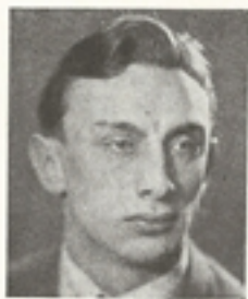
Csik Ferenc, olimpiai bajnok:

a vakok látnak, a süketek hallanak, a némák beszélnek, a bénák járnak s a szegényeknek hirdettetik az evangélium!