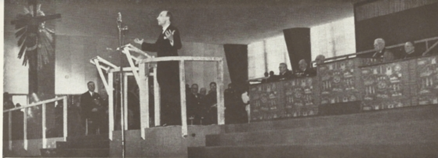
vitéz Imrédy Béla miniszterelnök beszél a második nemzetközi gyűlésen