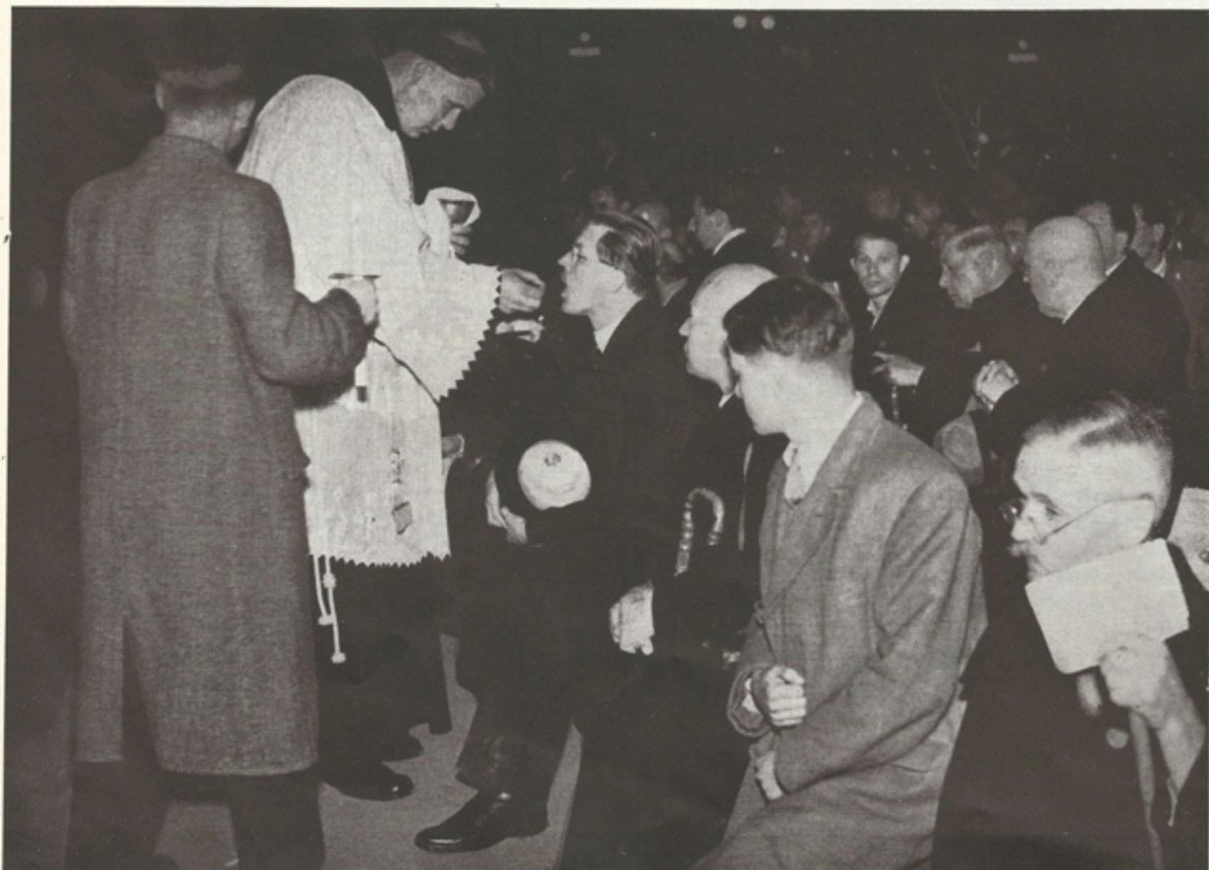
Az éjszakai szentáldozás

Nem volt-e onnét éveken át száműzött király a szentségi Krisztus? Keresztény katolikus vagy? Mikor vetted utoljára magadhoz a szentségi Krisztust? Mikor áldoztál utoljára? Talán házas-