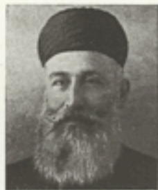
Mgr. Daccache József püspök (Libanon—Szíria):

A kanadai katolicizmus: egyszerre jelent nagy tradíciókba gyökerező, történelmi multú, modern stílusú nagyvárosi pasztorációs munkát és társadalmi tevékenységet, ugyanakkor a messze északon folytatott nagy és szép missziós működést: az Egyház világosságát a Sarkkör táján. Ennek a katolicizmusnak nevében köszöntötte és üdvözölte képviselőjük a messze Európa és Magyarország Világkongresszusát, kifejezve örömét, hogy Kanada katolikusai szerencsések lehetnek az Eucharisztikus Krisztus hívői közé tartozni, kifejezve hódolatát s tiszteletét a Szentséges Atya küldötte, személyének helyettese, Pacelli bíboros iránt.