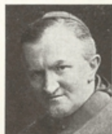
Browne Mihály püspök (Galwoey):

a kereszténység most tör utat az ősi pogányság között, olyan föld-képviselője szólalt fel, ahol a kereszténység már másfélezer éves hagyomány: Irországé.