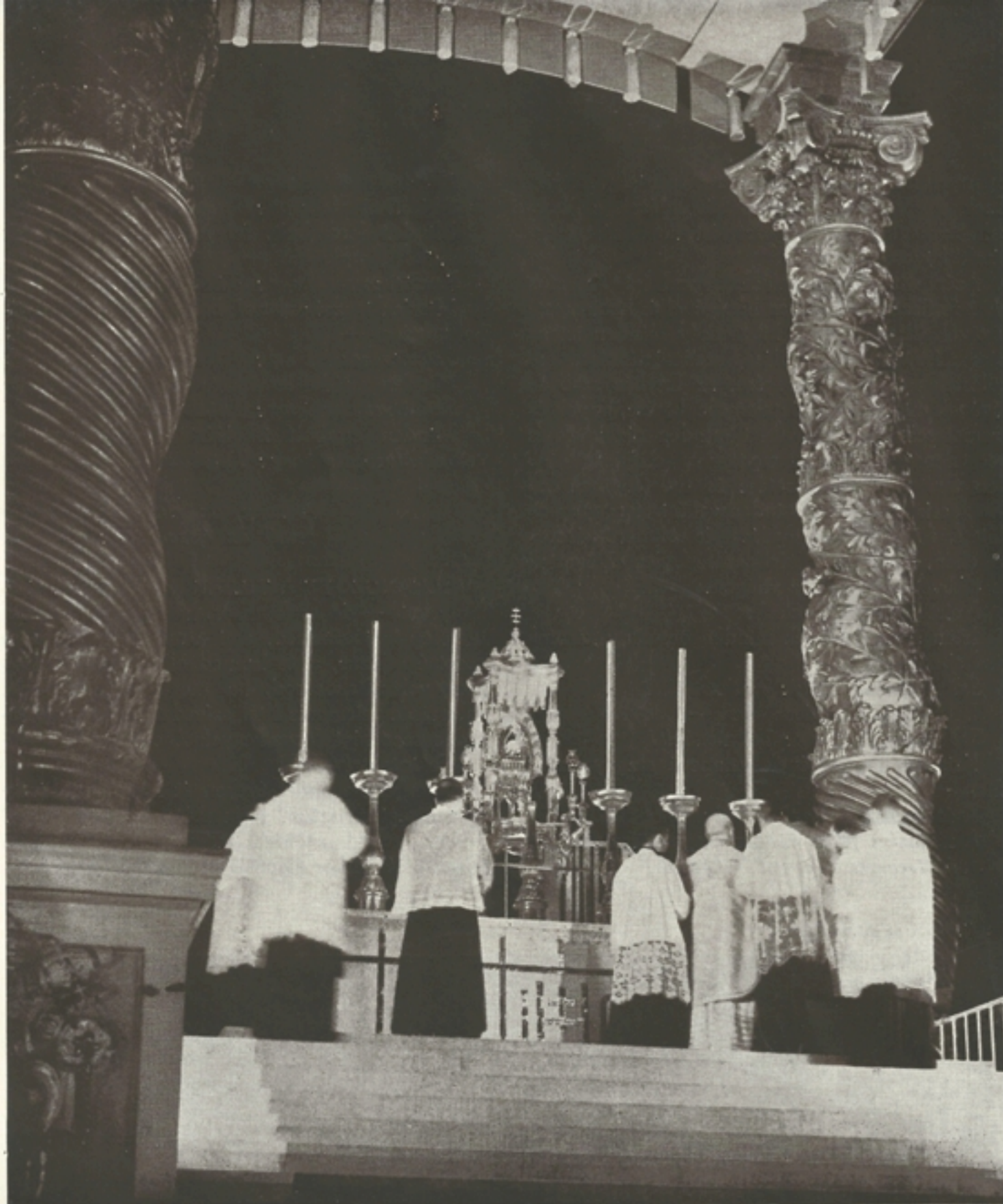
Goma y Thomas bíboros éjféli szentmiséje

Mily csodákat művel! Áttöri a természet törvényeinek acélfrontját, hogy köztünk lehessen; eledelül adja magát nekünk!