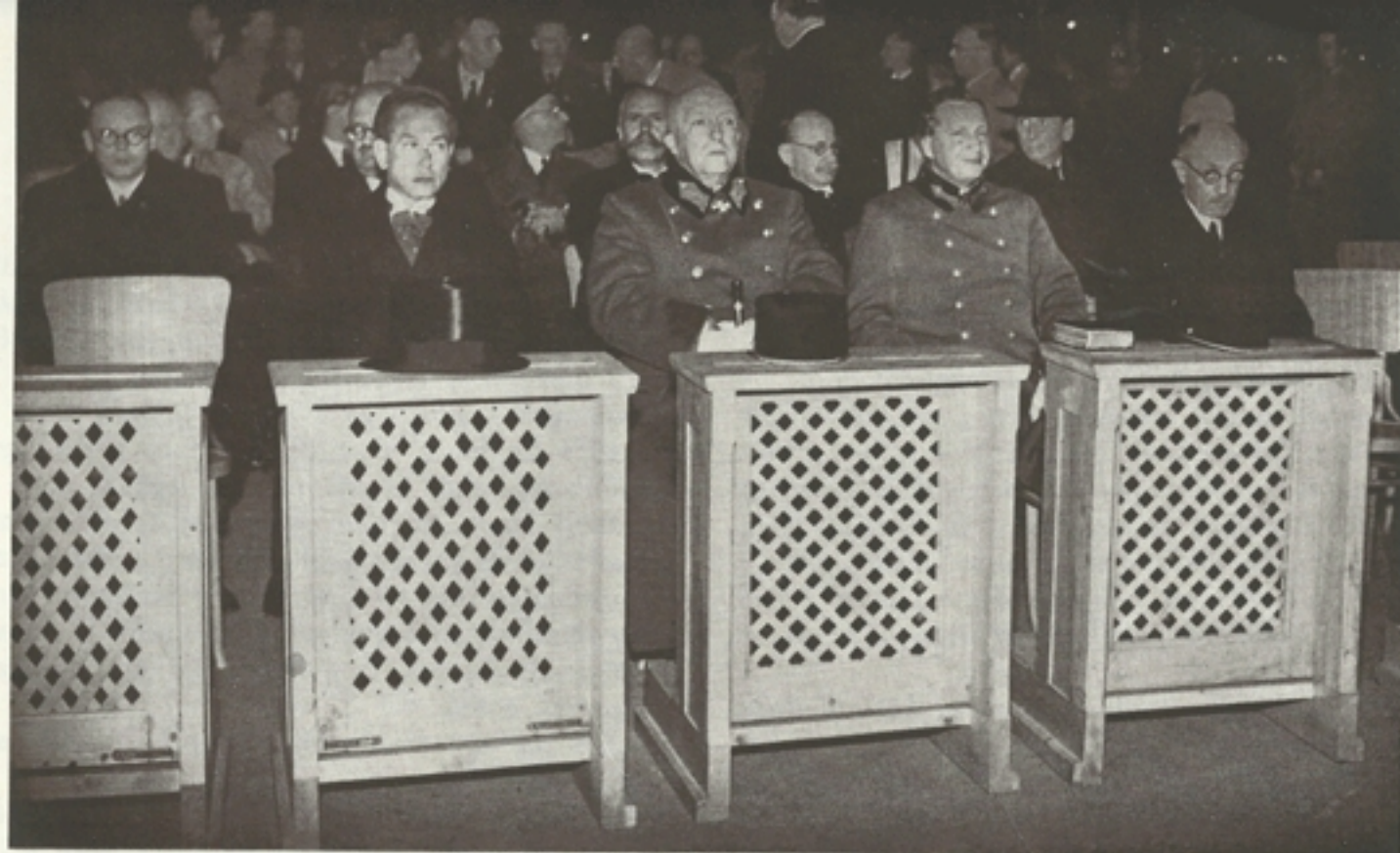
Albrecht főherceg, József főherceg, József Ferenc főherceg, Teleki Pál gróf kultuszminiszter az éjszakai szentségimádáson

ságod óta nem? Talán még akkor sem? Talán első áldozásod óta nem? Talán még soha? Vagy már nagyon régen? Öt, tíz, húsz, harminc év előtt? Vonjon most Szívéhez a szentségi Krisztus!