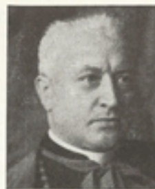
Hlond Ágoston bíboros-érsek Lengyelország primása: