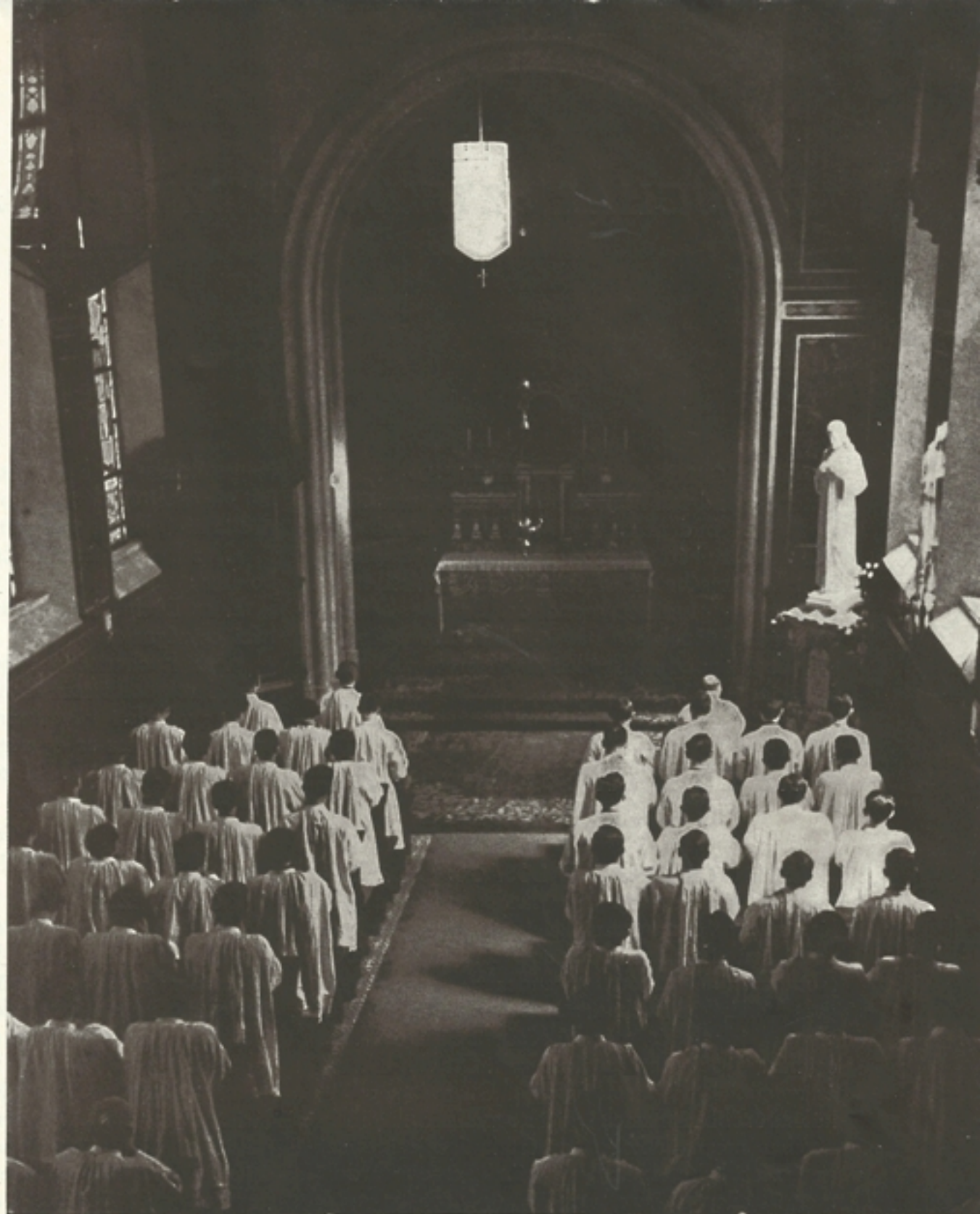
Az Eucharisztikus Krisztus diadaláért

1938 MÁJUS 28, SZOMBAT (SZENT ÁGOSTON NAPJA) A KONGRESSZUS HARMADIK NAPJA