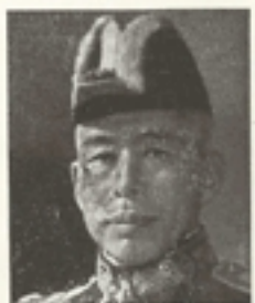
Yamamoto Sinkiro István (Tokió):

Utána ismét ősi nép és ősi kultúra szólalt meg: Japán képviselője, népe nyelvének kemény csengésű hangjain: Yamamoto admirális.