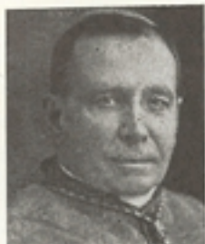
Audolent György bloisi püspök:

A nagy tapssal fogadott beszéd után Audolent György bloisi püspök tartott francia beszédet, a magyar és francia katolicizmus kapcsolatairól.