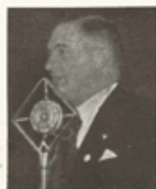
Bornemisza Géza, m. kir. iparügyi miniszter:

Igy tartozik az Eucharisztia elengedhetetlenül az önzetlen beteggondozáshoz. Belőle indul az ki és Benne végződik is. Ha minden beteg gondozását a vele szervesen kapcsolatos szociális kérdéseket meg akarjuk oldani, úgy feltétlenül szükségünk van az Eucharisziára!